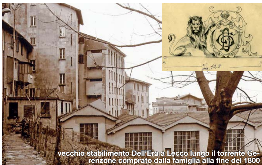
vecchio stabilimento Dell'Era a Lecco lungo il torrente Gerenzone comprato dalla famiglia alla fine del 1800

UNA DINAMICA AZIENDA IN CUI STORIA E TRADIZIONE SI FONDONO PERFETTAMENTE CON UNA MODERNA E FLESSIBILE ORGANIZZAZIONE PRODUTTIVA E LOGISTICA